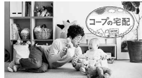
「きらきらステップ編」