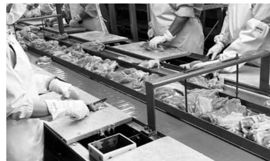
カット工程の様子

「鶏を愛し、病気になるやうに育てるかのやうに暖かく見守る養鶏家の皆さんの生の声をお聞き出来て、嬉しかったです。今まで以上に利用することと組合員にしっかりと伝えて、さらなるひろがりを目指します。」「改めて命をいただいていることを実感できる機会となりました。貴重な工場やヒヨコの映像にさばきかたの実演、オンラインだったからこそできる愛情がとてと伝わりました。」「ヒヨコへの多くの感想が寄せられました。」など、参加者から多くの感想が寄せられました。 一部の会員生協の広報担当職員も参加され、交流会の様子は会員生協の広報誌にも掲載されました。