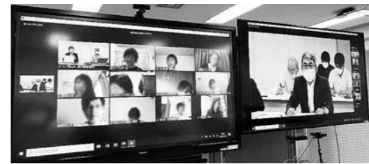
(画像を加工しています)

「鶏を愛し、病気になるやうに育てるかのやうに暖かく見守る養鶏家の皆さんの生の声をお聞き出来て、嬉しかったです。今まで以上に利用することと組合員にしっかりと伝えて、さらなるひろがりを目指します。」「改めて命をいただいていることを実感できる機会となりました。貴重な工場やヒヨコの映像にさばきかたの実演、オンラインだったからこそできる愛情がとてと伝わりました。」「ヒヨコへの多くの感想が寄せられました。」など、参加者から多くの感想が寄せられました。 一部の会員生協の広報担当職員も参加され、交流会の様子は会員生協の広報誌にも掲載されました。