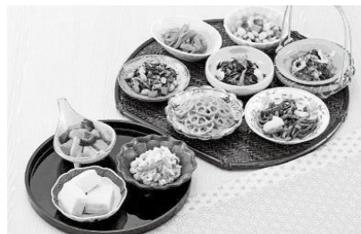
京の食卓おばんざいセット

菓子を中心に全国各地の名産や銘店品など自宅で手軽に楽しめる話題のお取り寄せ品、生産量に制約のある商品を企画します。