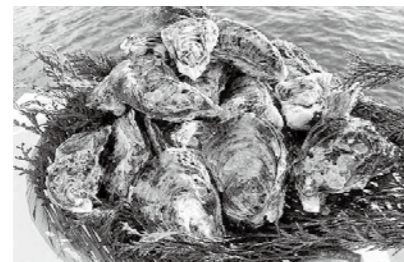
播磨灘産 生殻付き牡蠣