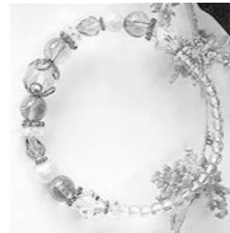
プレスレットのぞき ききょう

食器のセット物や地域の工芸品、寝具をはじめとした家庭用品やアクセサリーなど生協宅配とはカテゴリーやグレードで差別化をすすめていきます。