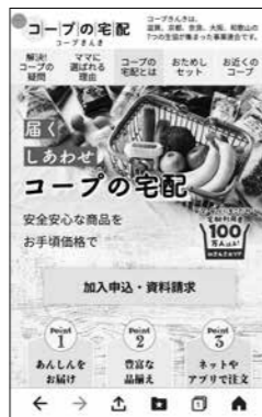
ランディングページ

CM「コープいいところ発見隊」を、9月に約2週間、朝日放送、関西テレビ、読売テレビで放映しました。