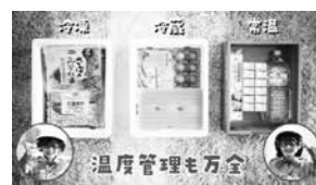
インターネット広告