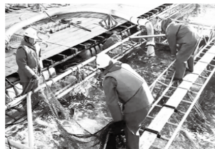
水揚げ(フィッシュポンプ)