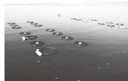
漁場全景(海上生簀)