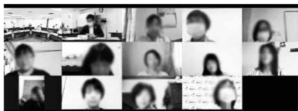
(画像を加工しています)

小池理事長が開会あいさつを行い、コープきんきの概略、新役員体制について報告しました。大島専務理事から「第18回通常総会の振り返りと重点課題具体化の進捗状況について報告しました。第18回通常総会は書面議決中心の開催となったため、会員生協代表員から総会に寄せられた特微的な意見をあらためて紹介し、それらを踏まえて重点課題の取り組みについて報告しました。