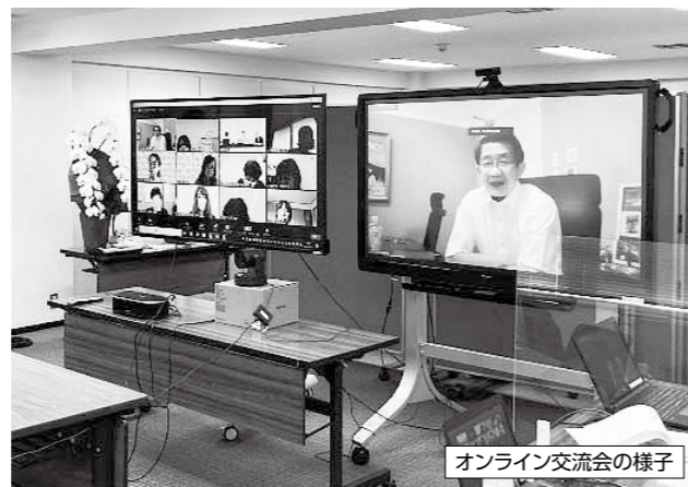
オンライン交流会の様子

参加者からは、「鮭の美味しい理由がこの学習会を通してわかりました。社長がおっしゃっていた『いいものをつくる』のお言葉に共感と応援の気持ちが湧いてきました」「職員の皆様の仕事に向き合う愛も感じられました。弓ヶ浜水産とサーモンのファンになりました!これから必ず利用します!」などの感想が寄せられました。