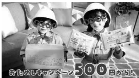
おたのしみキャンペーン500円おとし

また、3局の番組内でのCM「インフォマーシャル」も実施し、CO・OP商品を紹介しました。ランディングページ(ホームページ)の閲覧数は、昨年同時期やCM放映前と比べて大きく伸びました。