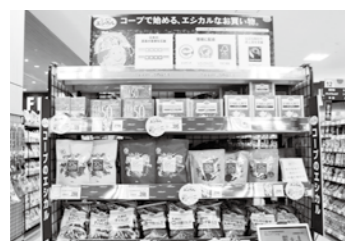
エシカル商品売場

<店舗概要> 住 所: 京都市山科区西野山中臣町 41-1 売場面積: 約 464 坪 営業時間: 9 時～ 21 時 駐車台数: 160 台 アクセス: 京都市営地下鉄東西線「柳辻」駅より、 京阪バス (17、88 系統) 「折上神社」下車すぐ