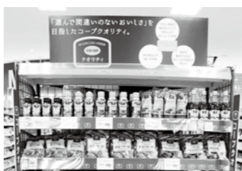
コープクオリティ売場