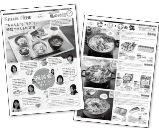
「キッチン・メモ」に掲載のレシピはホームページでご覧いただけます。

「キッチン・メモ」は商品案内本誌と違って、商品を購入するために閲覧されているのではなく、商品情報やレシピなどの情報を取得するための媒体として機能していることがわかりました。掲載されたら閲覧したい内容では、「時短に特化した商品とレシピ」「商品の便利な使い方」や「商品のごだわり・食べ方」などが上位となっています。紙面を改善する際には、レシピが見えるようにする、商品情報を強化するなど工夫が必要と思われる。