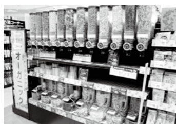
オーガニック商品売場