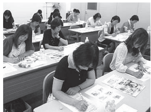
テストキッチンの様子