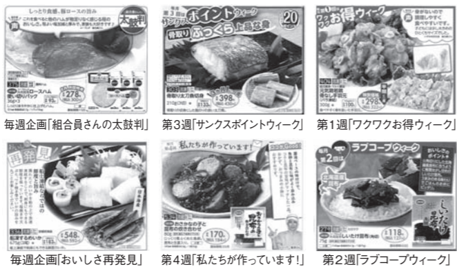
第1週「ワクワクお得ウィーク」 第2週「ラブコープウィーク」 第3週「サンクスポイントウィーク」 第4週「私たちが作っています!」 毎週企画「組合員さんの太鼓判」 毎週企画「おいしさを再発見」

「ワクワクお得ウィーク」や「サンクスポイントウィーク」については、そもそも価格マークやポイント還元マークで判別できるので、週変りテーマに入れる必要はないのではとの声をいただきました。組合員の生の声をもとに、カタログの見せ方の改善につなげていきます。