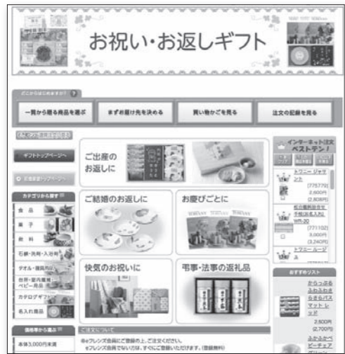
「お祝い・お返しギフト」トップページ