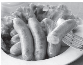
10月1回企画分から改善

原料価格の高騰により価格は据え置き、一袋「90g6本入り」から「80g標準5本入り」としました。その後、原材料の価格が低下気味になったことから、いただいていた声をふまえ、お取引先と商談を重ねた結果、以前の「90g6本入り」に仕様を戻すことにしました。価格についても値上げの予定はありません。