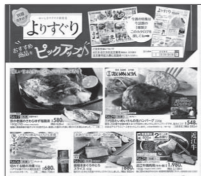
カタログ本紙での「よりすぐり」紹介