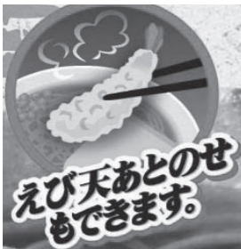
8月5回企画分から改善

その他にも「サクサク」のえび天を食べたいという声をいただいており、日本生協連の商品部で研究を重ねた結果、工程を変更することで、えび天を後のせすることができるようになりました。えび天を後のせする場合は、そばからえび天を取り外し電子レンジで加熱してください。なお、従来通りの調理方法でもおいしく召し上がっていただけます。