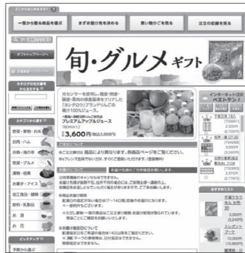
「旬・グルメギフト」トップページ