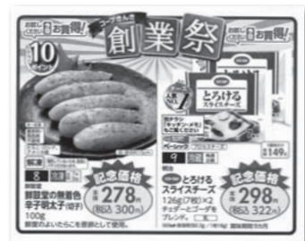
第2四半期の供給対策「創業祭」プロモーション(7月)

粗利益率(GPR)は、第2四半期26.90%(予算差▲0.09%、前年差▲0.36%)となり予算を下回りましたが、上半期累計では27.14%(予算差+0.11%、前年差▲0.10%)と予算を上回りました。粗利益高は、第2四半期105億9,191万円(予算比96.5%、前年比101.3%)、上半期累計では214億968万円(予算比97.4%、前年比101.9%)となり予算を下回りましたが、前年実績は確保しました。