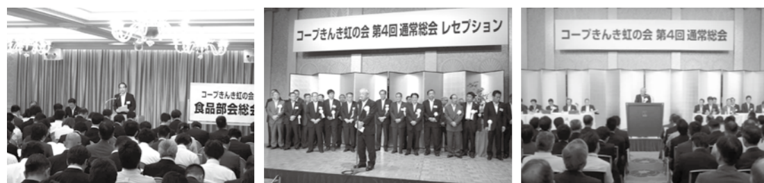
部会総会の様子(食品) レセプションの様子 総会の様子