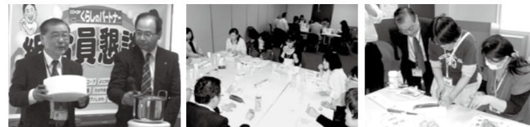
メーカーさんによる説明 分散会の様子 実際に使ってみる