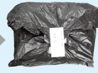
見えにくい袋に入れて商品のシールを貼ってお届け