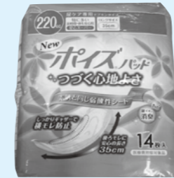
現在は商品を包装なしでお届け