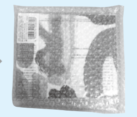
緩衝材(プチプチ)に入れてお届け