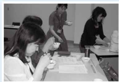
「聞かせて！井戸端モニター会」(いずみ市民生協)

このモニター会を「組合員の声と願いでコープ商品を作る」活動の基本と位置づけ、これからはとりくみを強めていきます。