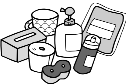
<2009年度第1四半期 無店舗非食品事業>

第1四半期の供給高は71億6605万円（予算比 98・9％、前年比 98・6％）、荒利益高24億9005万円（予算比 95・3％、前年比 96・3％）となりました。 生活必需品を中心とした日用消耗品は、売場の拡大と「くらし応援宣言」商品の打ち出しで、利用人数が前年比106・0％となり、予算比、前年比ともに大きく伸びましたが、売場を絞り込んだ家庭用品の利用不振から、非食品全体では供給高・荒利益高とも予算・前年を下回りました。